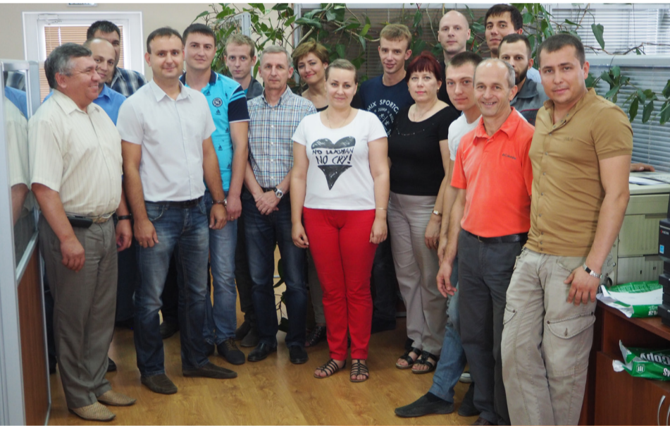
Конструкторский отдел и технологический отдел.2